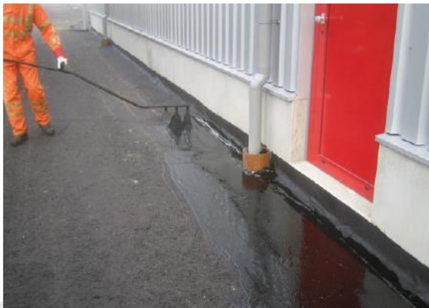
Foto: Aanbrengen bitumineus membraan.

De aannemer voorkomt dat het membraan zijn afdichtende eigenschappen verliest, door bijvoorbeeld beschadigingen door mechanische belasting of door een te hoge temperatuur van de laag die op het membraan wordt aangebracht.