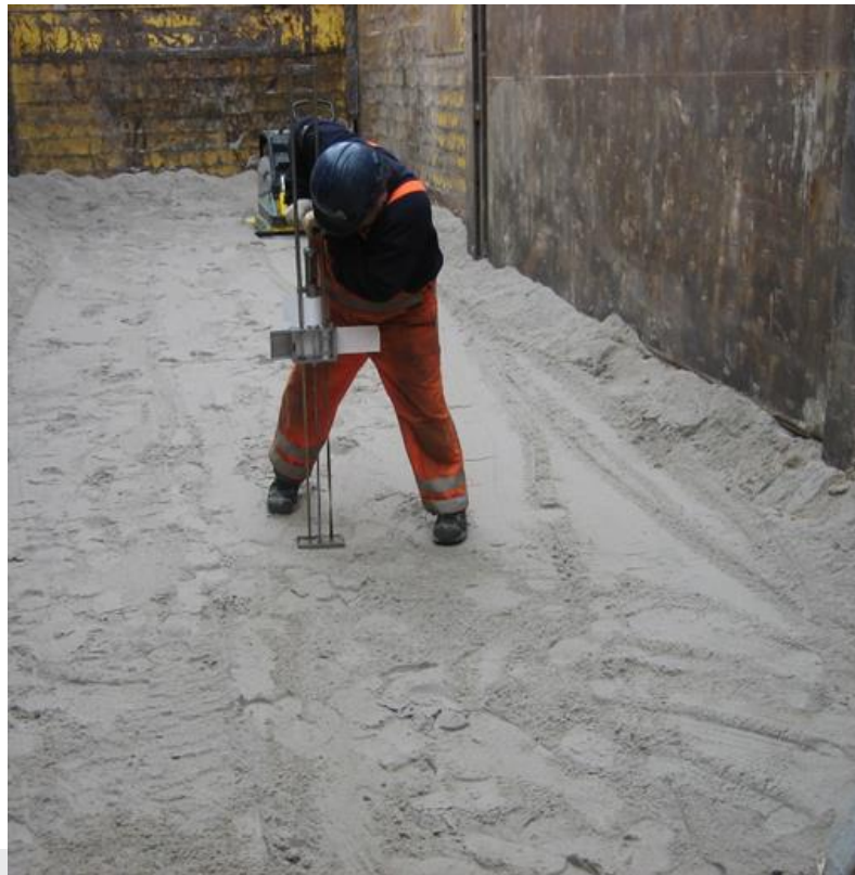
Foto: Voorbeeld van een controlemeting van de indringweerstand.