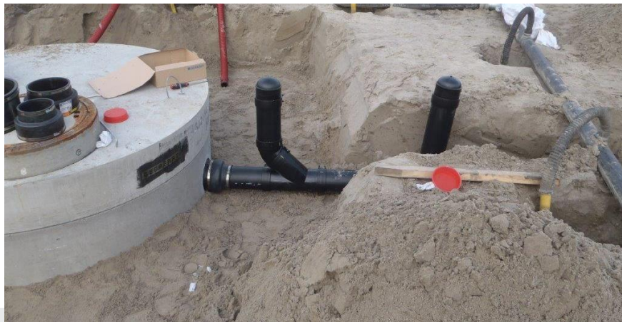
Foto: Voorbeeld van voorzieningen voor controle van de bedrijfsriolering op waterdichtheid. Aansluiting van de bedrijfsriolering (hdpe) op de prefab betonnen slibvangput.

Om het beproeven van de dichtheid te kunnen uitvoeren, monteert de aannemer in de toevoerleiding naar de slibvangput, kort voor de aansluiting daarop, een inspectieput met diameter van minimaal 300mm. De inspectieput moet vloeistofdicht worden afge-werkt en de afdekking moet voldoen aan hetgeen in hoofdstuk 2.7 is vermeld T-stuk van 90° en/of een T-stuk van 45°, of een andere installatie waarmee leidinggedeelten eenvoudig kunnen worden afgesloten en beproefd.