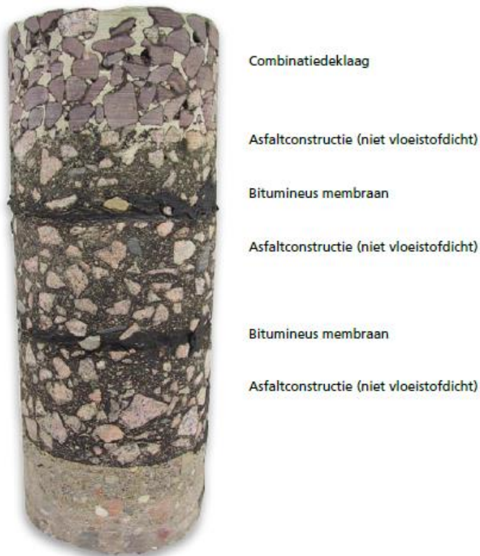
Foto: Voorbeeld van de opbouw van een combinatiedeklaag (bron: VBW Handleiding vloeistofdichte bitumineuze constructies).